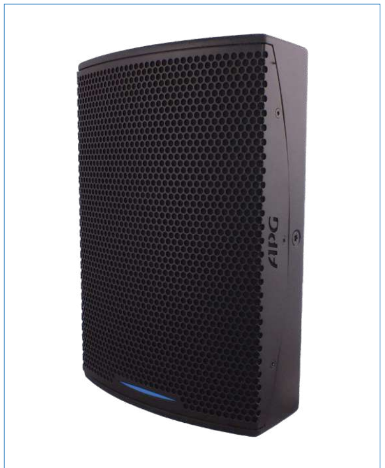
Enceinte iX8 M2

L'iX8 M2 est une enceinte satellite optimisée pour la sonorisation de haute précision en installation fixe en intérieur. Ses dimensions réduites la destinent à la sonorisation des petites surfaces ainsi qu'à la couverture répartie de grands espaces devant respecter un critère de discrétion.